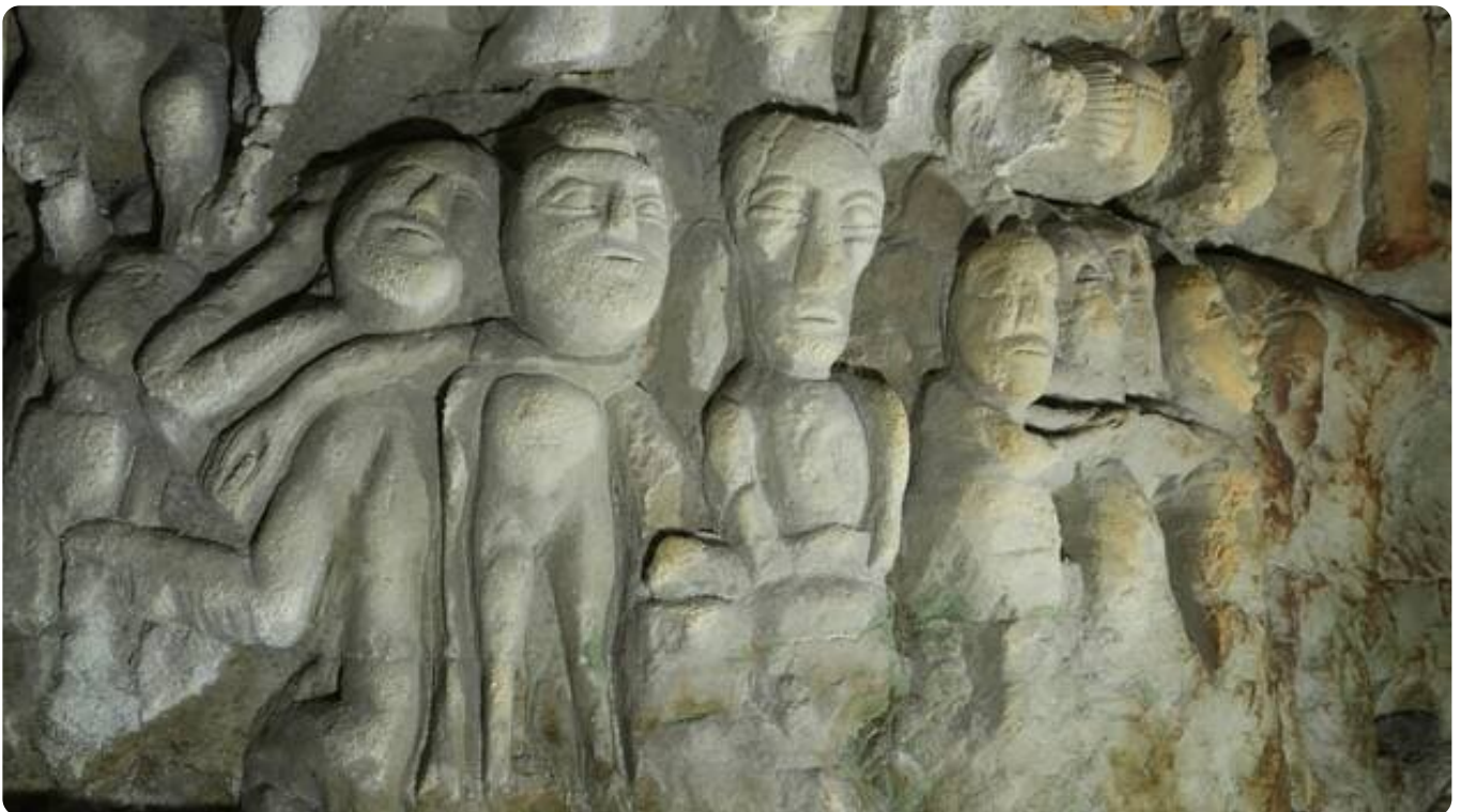
Sauf retournement de situation, la cave aux sculptures ne rouvrira pas avant les Journées du patrimoine en septembre.