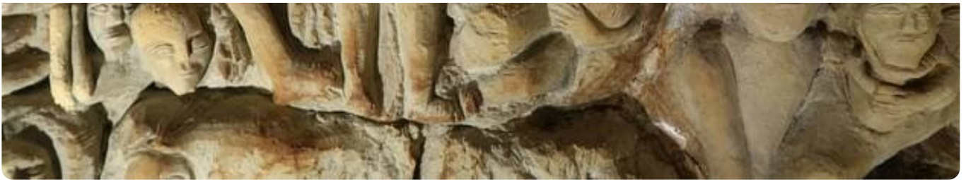
Humidité, salpêtre... les trésors de la Cave aux sculptures de Denezé-sous-Doué se dégradent d'année en année...