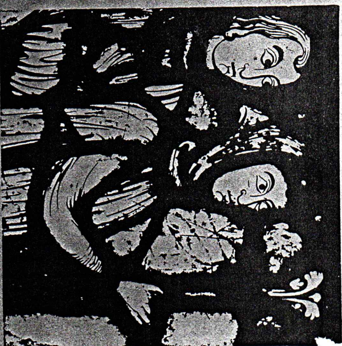
CHÂTEAUX - ÉTRANGERS - 11116

* Communautés oecuméniques et interrationnelles Toute l'année : du lundi au vendredi à 12h et dimanche à 14h.