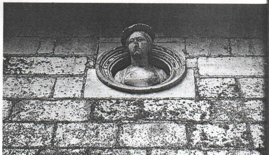
Des mystérieux bustes jaillissent du mur

« Le caractère même du prieuré va subir de profonds changements, note Alain Braguier. Alors qu'au cours des siècles précédents, la vie proprement monastique, la prière, le recours aux malades, l'accueil des hôtes de pas- sage, de toutes conditions, consti- tuaient le principal soin du prieur et des frères, sous l'influence des idées nouvelles et du relâchement des mœurs, les nouveaux titulaires donneront la primauté à la qualité de "fief sei-