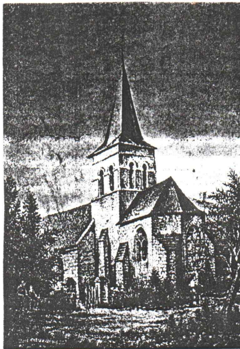
Eglise de Denezé-sous-Doué, clocher du XI e siècle, flèche de 1713.

L'église St Jean-Baptiste est élevée au X e siècle sur le ruisseau de Daret Varenne. Les hommes ont fait la chaîne pour acheminer les pierres d'extraction de l'ancien prieuré de SAUGRE à l'église actuelle.