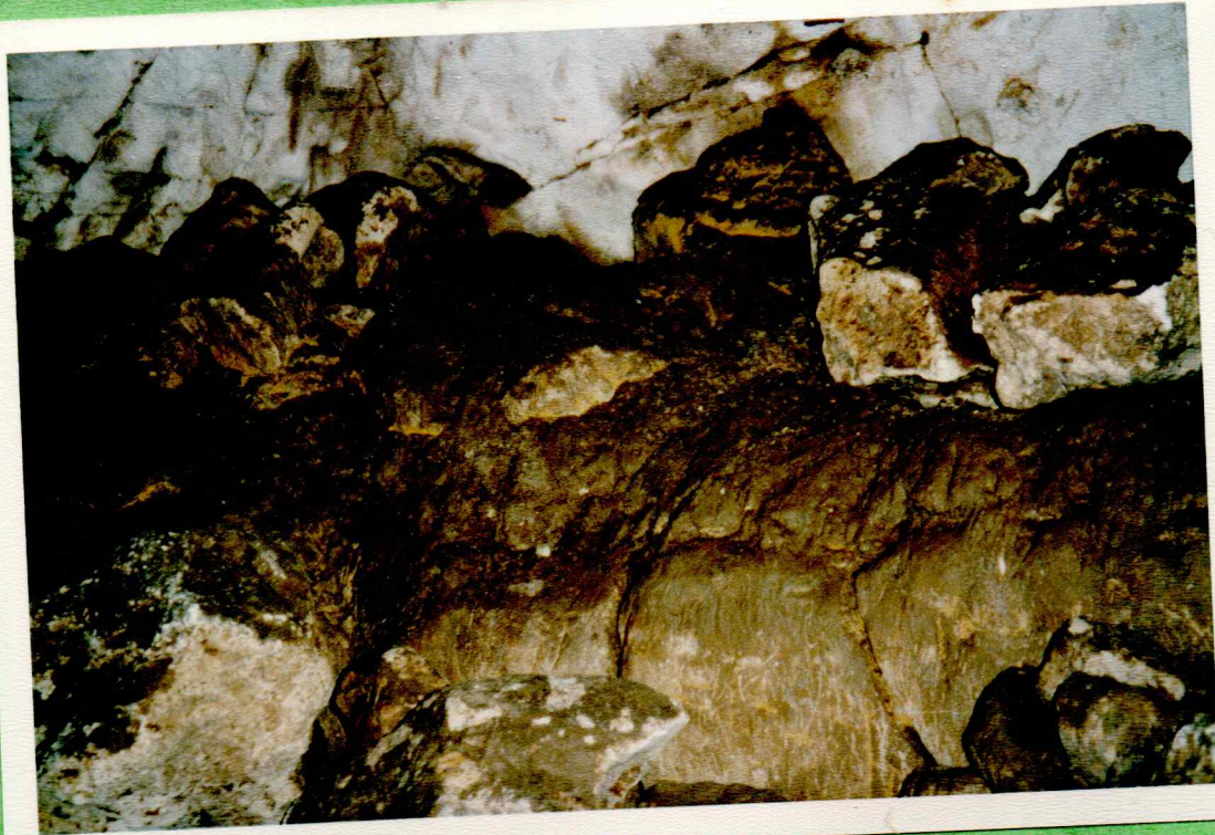
dans le refuge, banc en pierre.