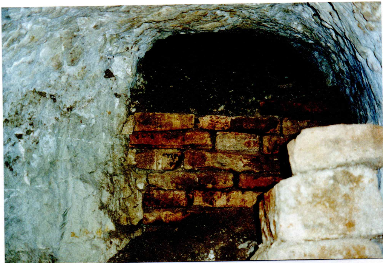
Fonds du souterrain.