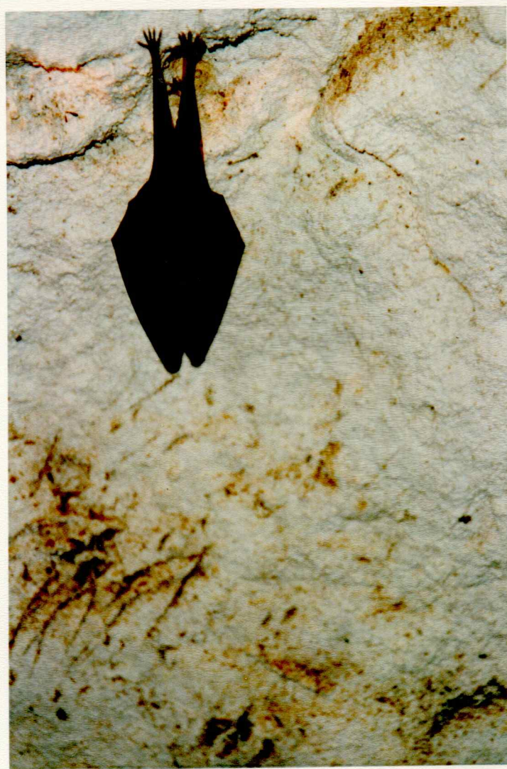
la chauve-souris respire toutes les 90 mn en hibernation